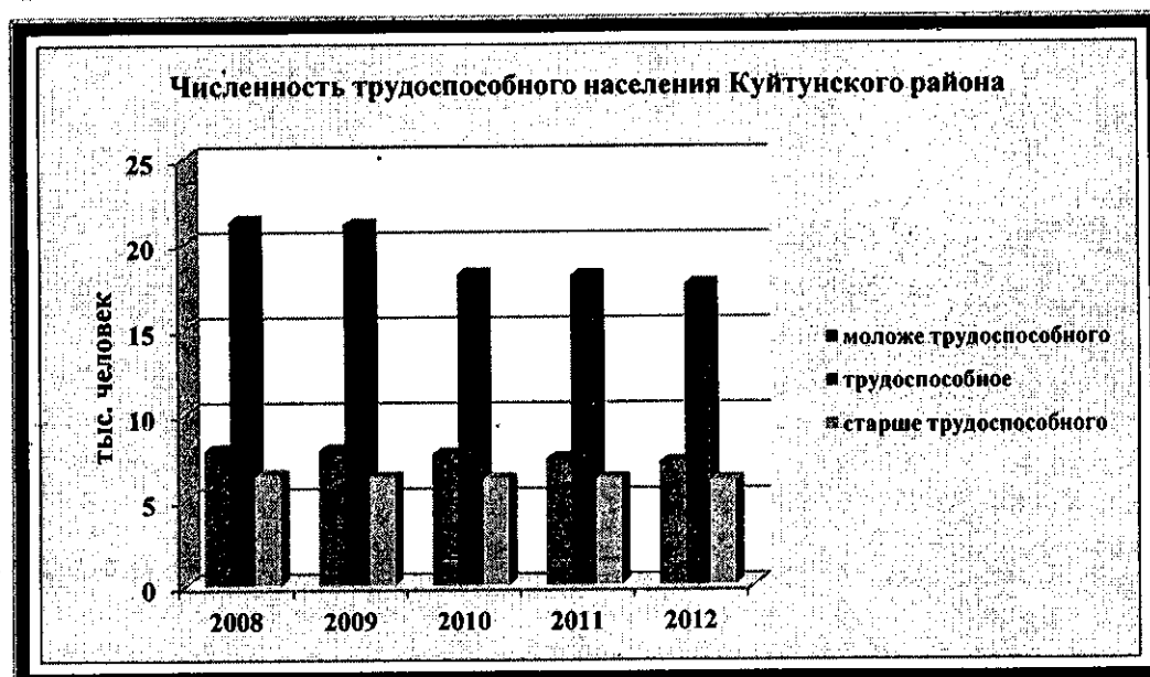
Рис. 2. Численность трудоспособного населения Куйтунского района

Наблюдается уменьшение трудоспособного населения, причем наиболее квалифицированной его части, рост заболеваемости населения и другие негативные демографические явления.