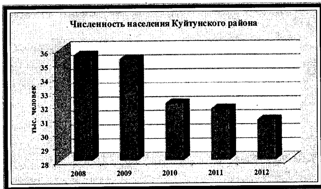
Рис. 1. Численность населения Куйтунского района

В Куйтунском районе наблюдается сокращение численности населения: